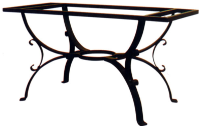
Art. L115 Tavolo in ferro battuto h cm. 75;