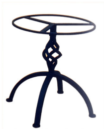
Art. L110 Tavolo in ferro battuto h cm. 50;