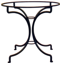
Art. L109/A Tavolo in ferro battuto h cm. 75;