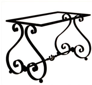
Art. L112 Tavolo in ferro battuto h cm. 50;