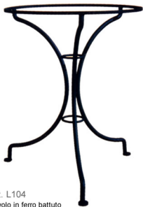
Art. L104 Tavolo in ferro battuto h cm. 70;