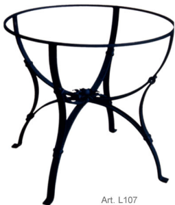
Art. L107 Tavolo in ferro battuto h cm. 75; diametro cm 90