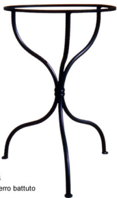
Art. L103 Tavolo in ferro battuto h cm. 70;