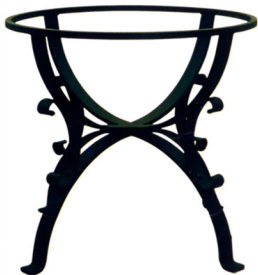
Art. L106 Tavolo in ferro battuto h cm. 75; diametro cm 90